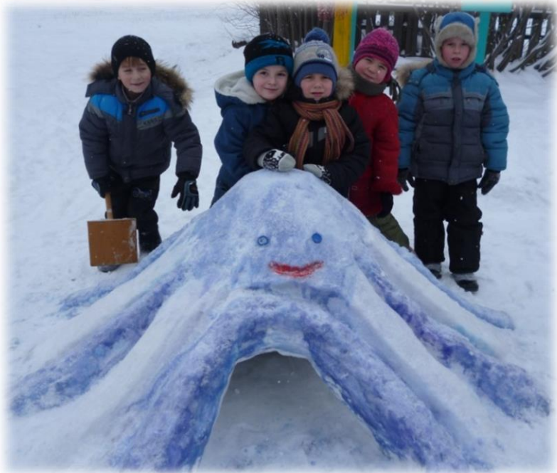
Осьминог для подлаза

Прогулочный участок ДОО имеет свои особенности оформления в зимний период. Зимние постройки придают эстетическое оформление территорий дошкольной организации; - создаются условия для проведения полезного досуга детей в зимний период; - способствуют развитию творческих и художественно-эстетических способностей воспитанников; - несут в себе функцию здоровьесбережения Работа по оформлению двора проводится с целью создания условий для активного и разнообразного отдыха наличие мест для проведения игр на свежем воздухе.