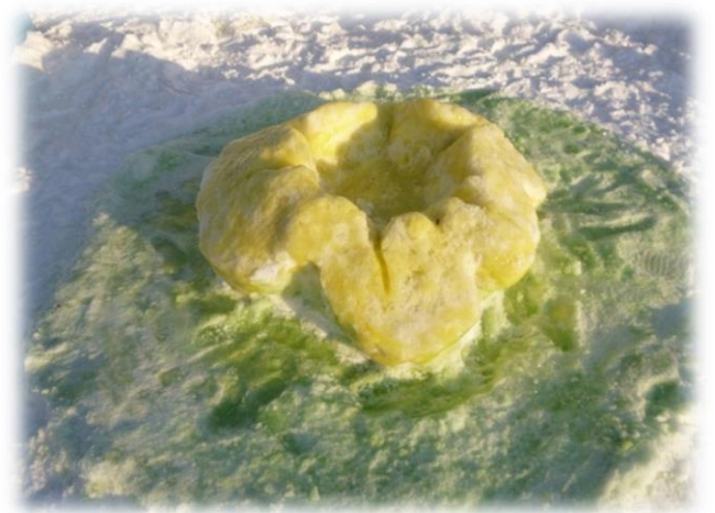
Попади в центр