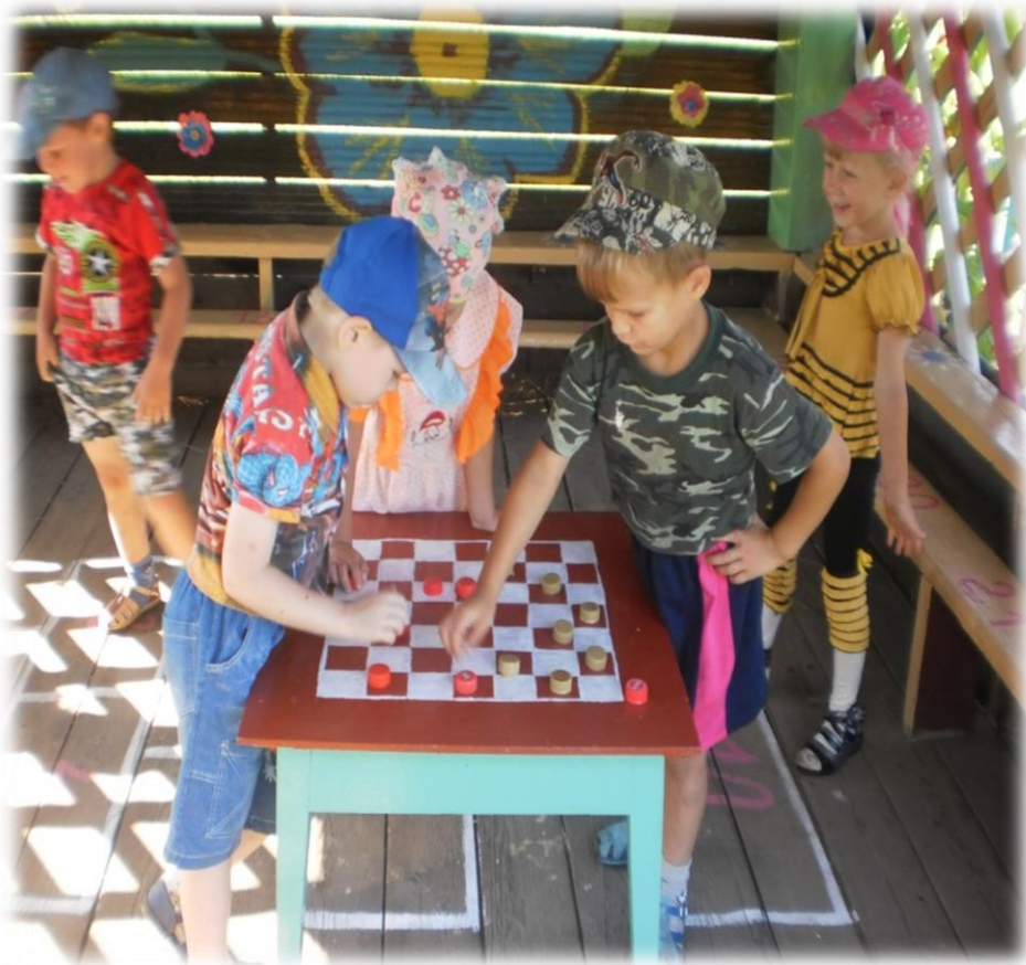
Играем в шахки