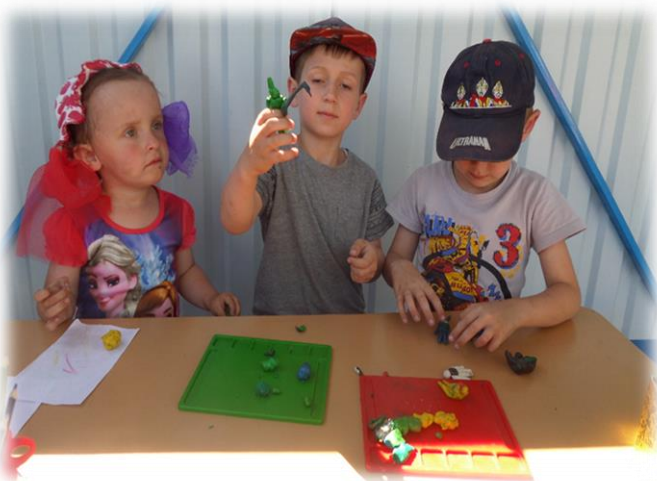
Лепка из пластилина

Таким образом, художественно-эстетическая зона дает возможность реализовать творческие способности каждого ребенка.