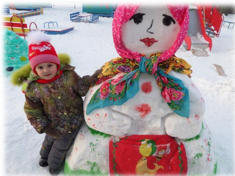
Снежные персонажи для эмоционального развития детей