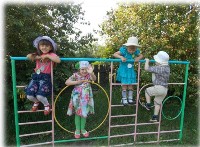
Стена для лазания