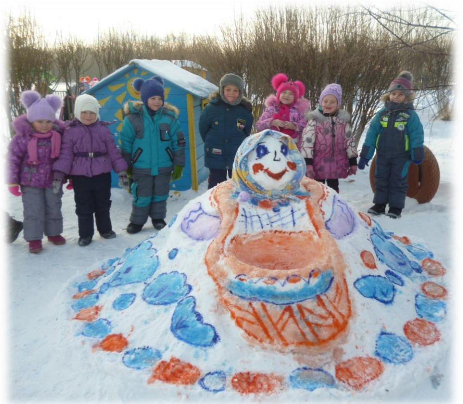
Попади в лукошко у матрешки