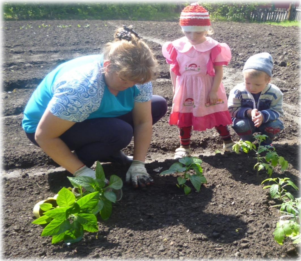
Наблюдение за высадкой перцев