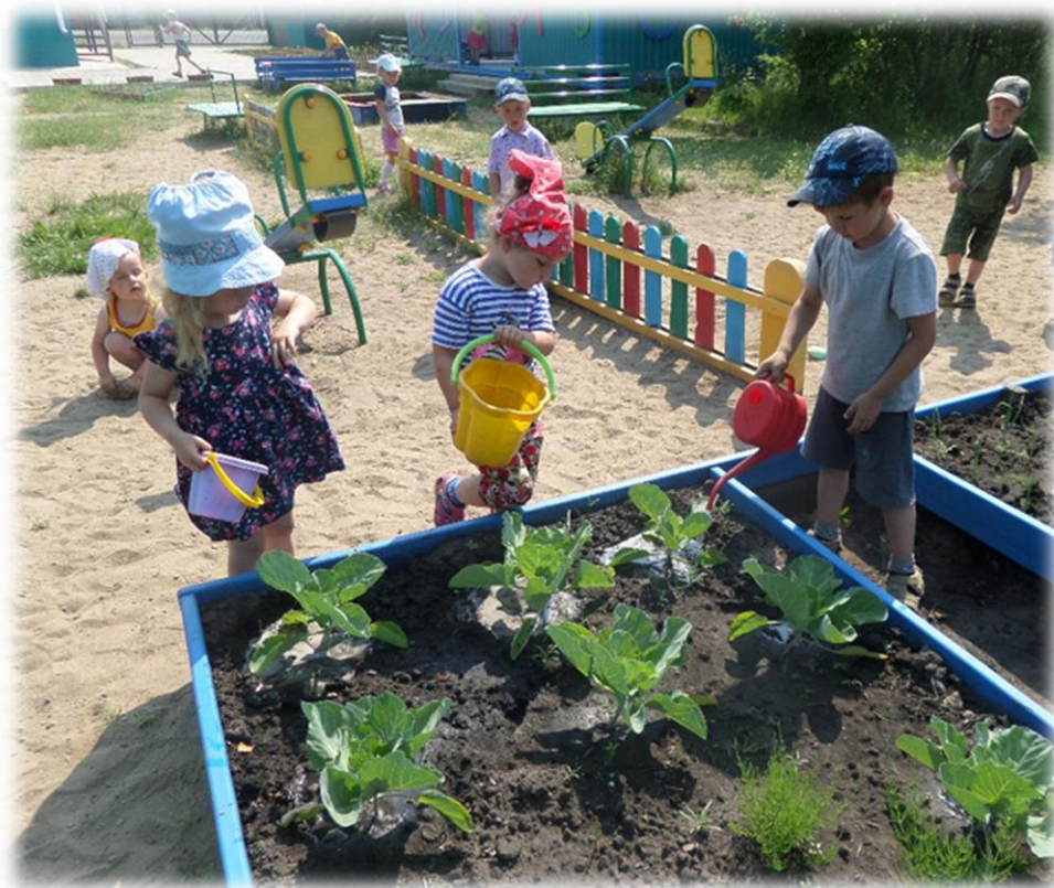
Труд в природе «Работа на приусадебном участке»

В летний период в беседках выставляются комнатные растения. Для ухода за растениями имеются лейки, распылитель для опрыскивания растений, заостренные деревянные палочки для рыхления земли в горшках, мягкие кисточки для очистки от пыли листьев растений. Также имеется мини-огород.