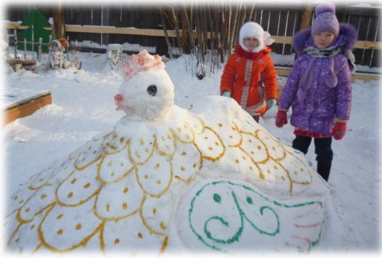
Обойди курочку приставным шагом