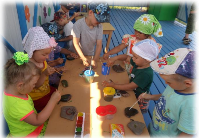
Рисование на камнях