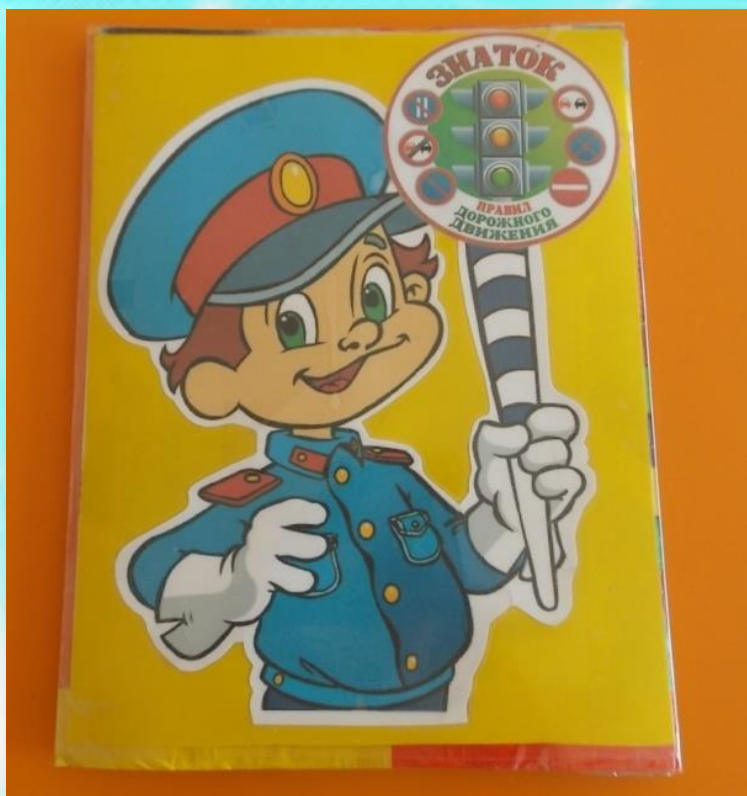
Лепбук «Знарок дорожного движения»