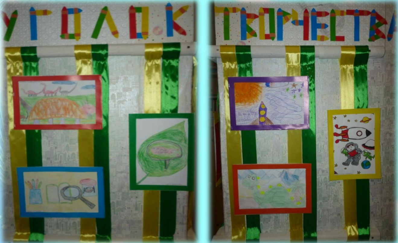
Выставка детского рисунка к проекту «Что такое наука?»