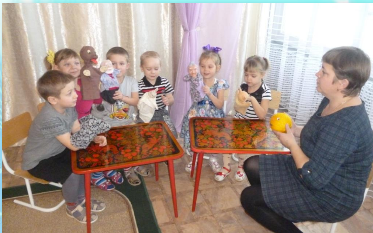
Игровой прием «Продолжи сказку по-новому»