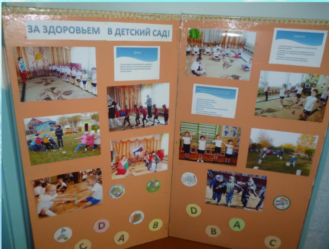
Проект «Как стать здоровым?»