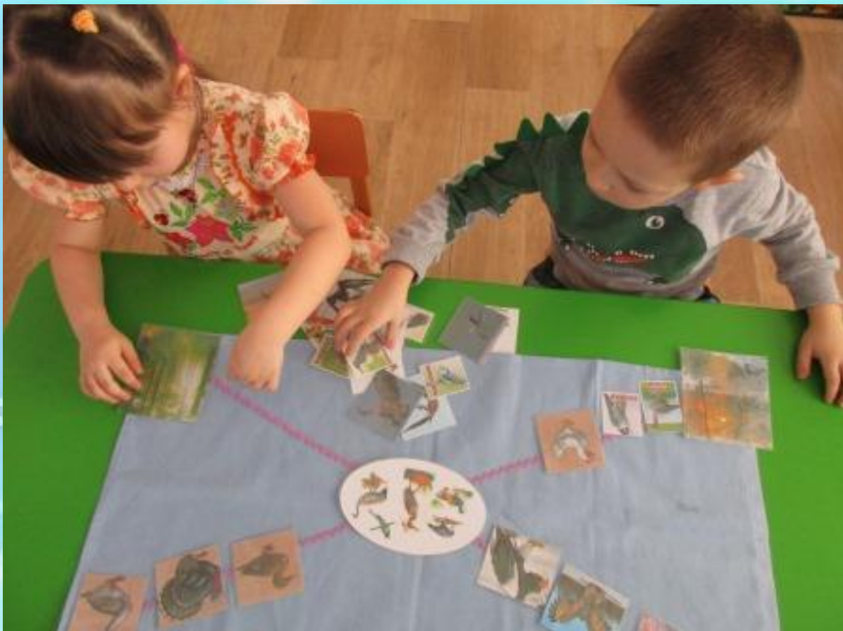
Работа воспитанников с интеллект-картой «Птицы Прибайкалья»