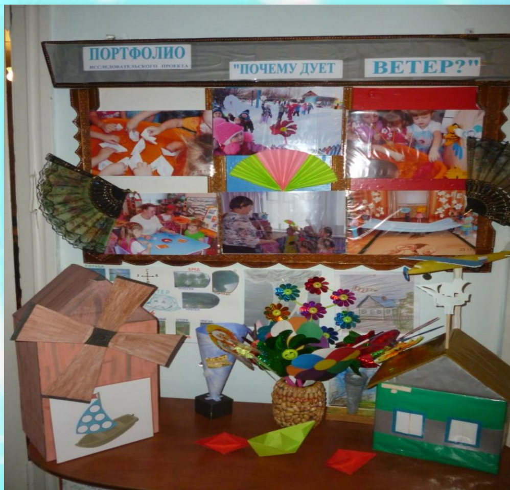
Портфолио проекта «Почему дует ветер?»