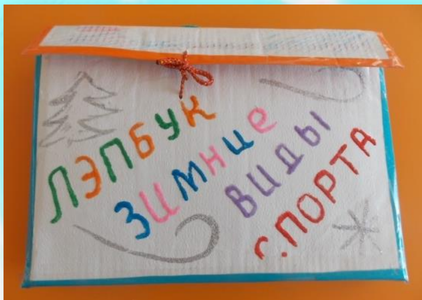
Лепбук «Зимние виды спорта»