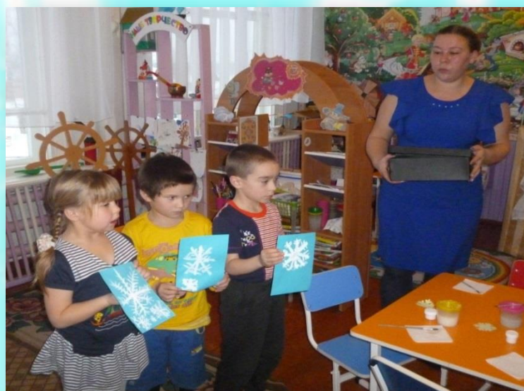
Защита работы лидерами группы