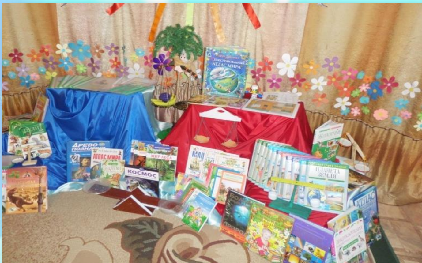
Выставка к проекту «Вокруг света»