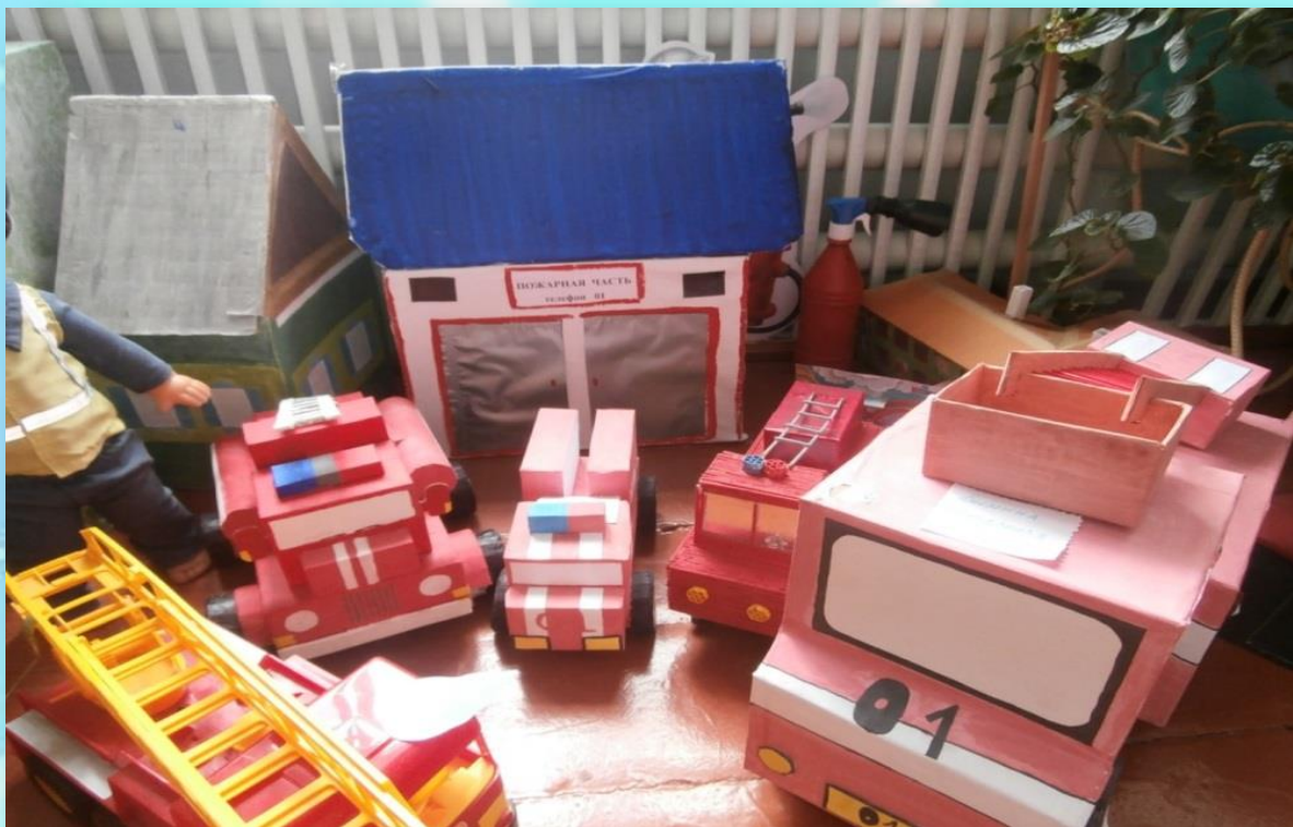
Макетирование к проекту «Почему пожарная машина красного цвета?»