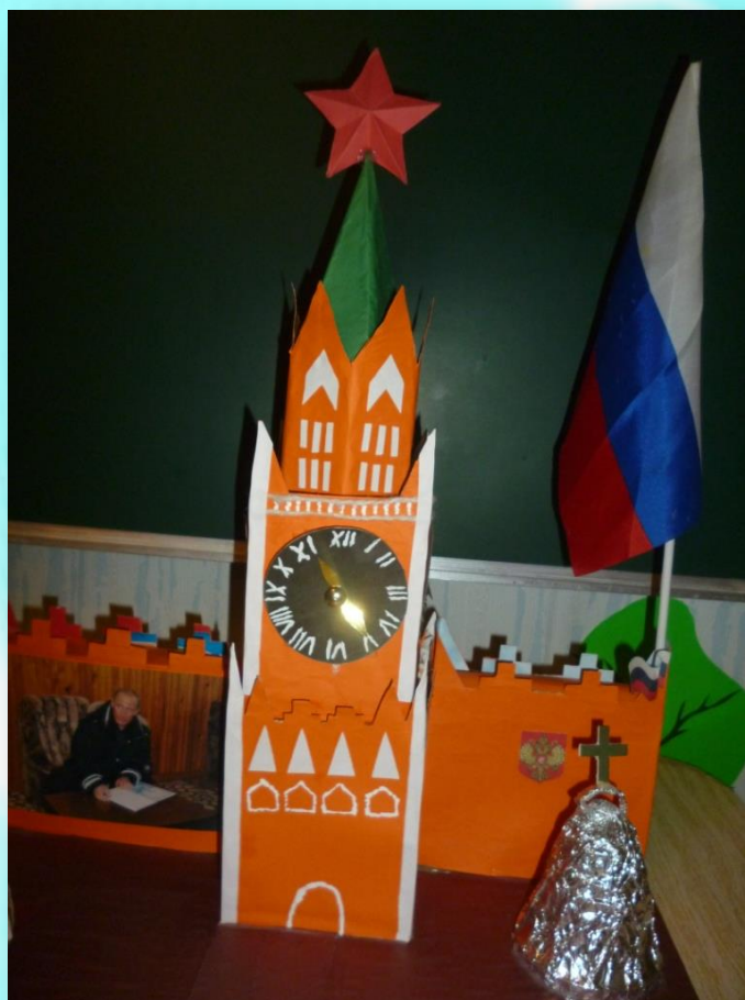
Макет «Красна площадь»