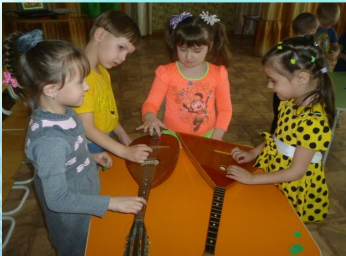
Деление детей на группы