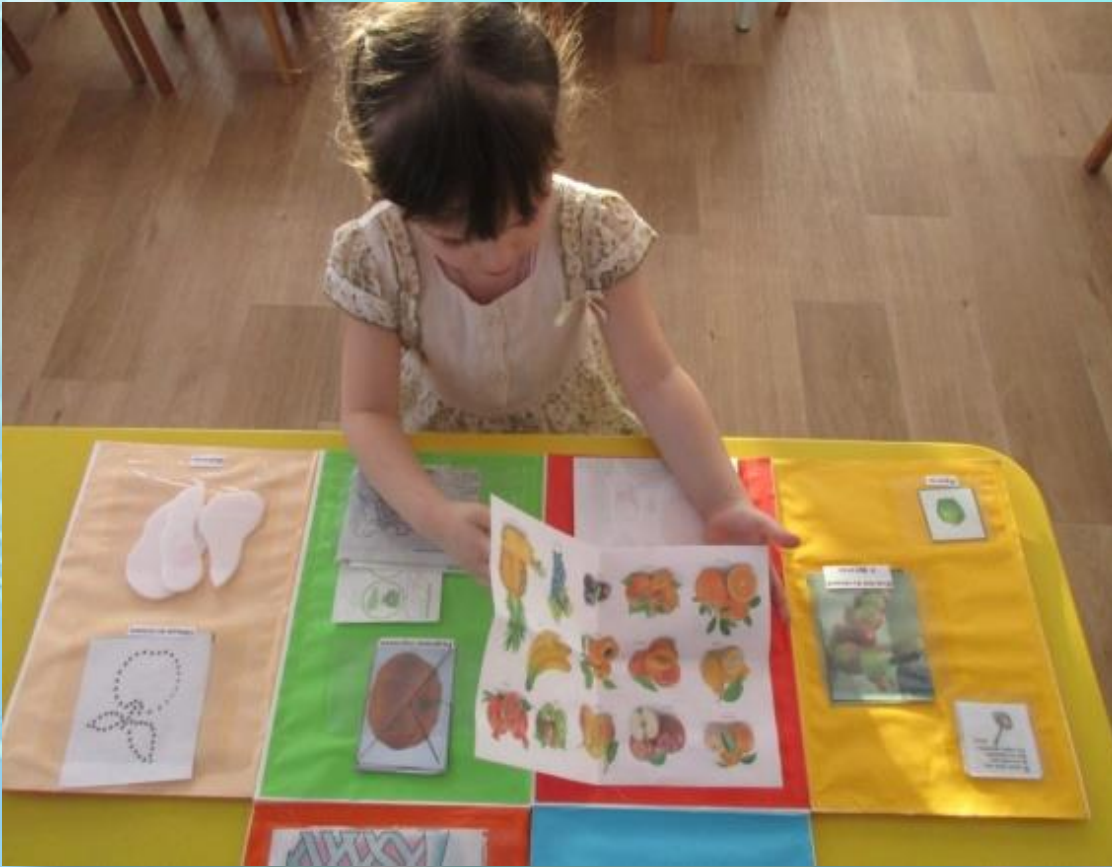
Лепбук в деятельности детей