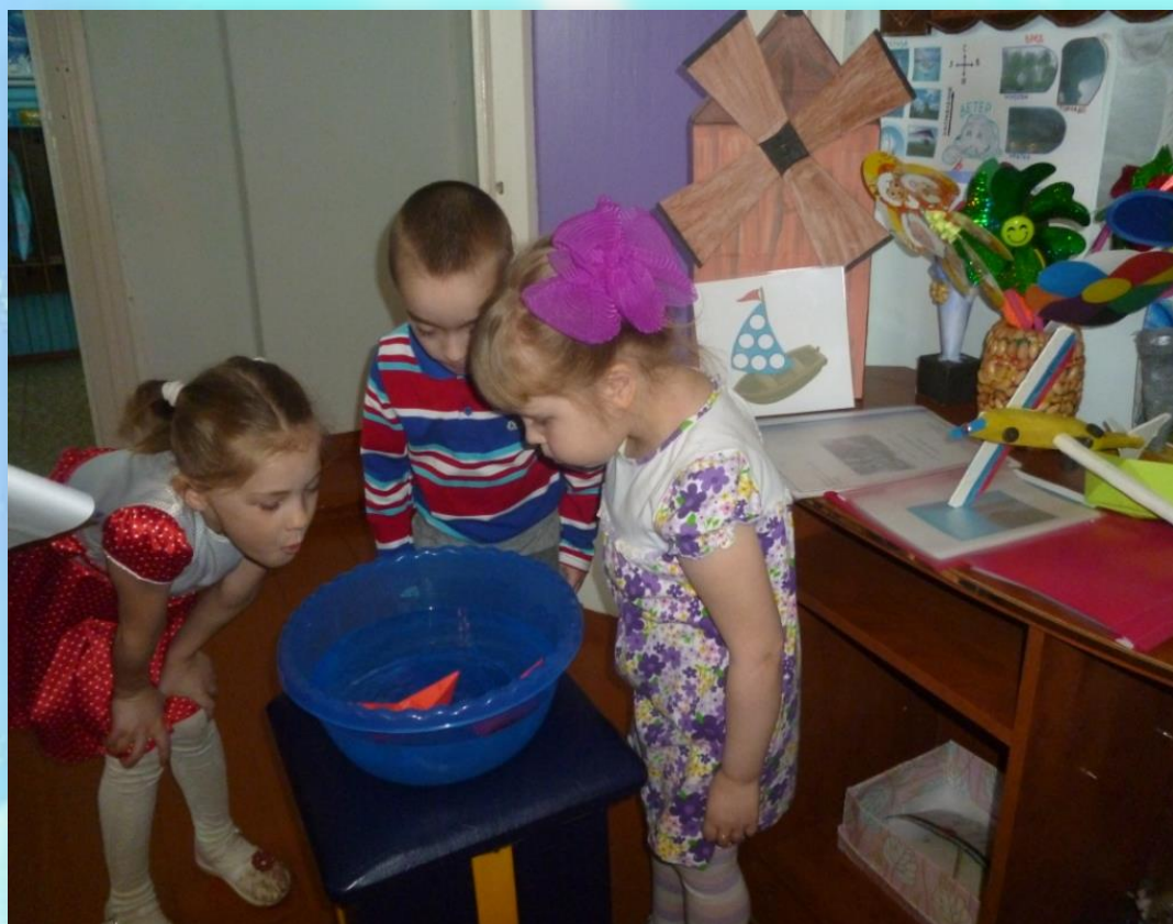
Защита выставки воспитанниками