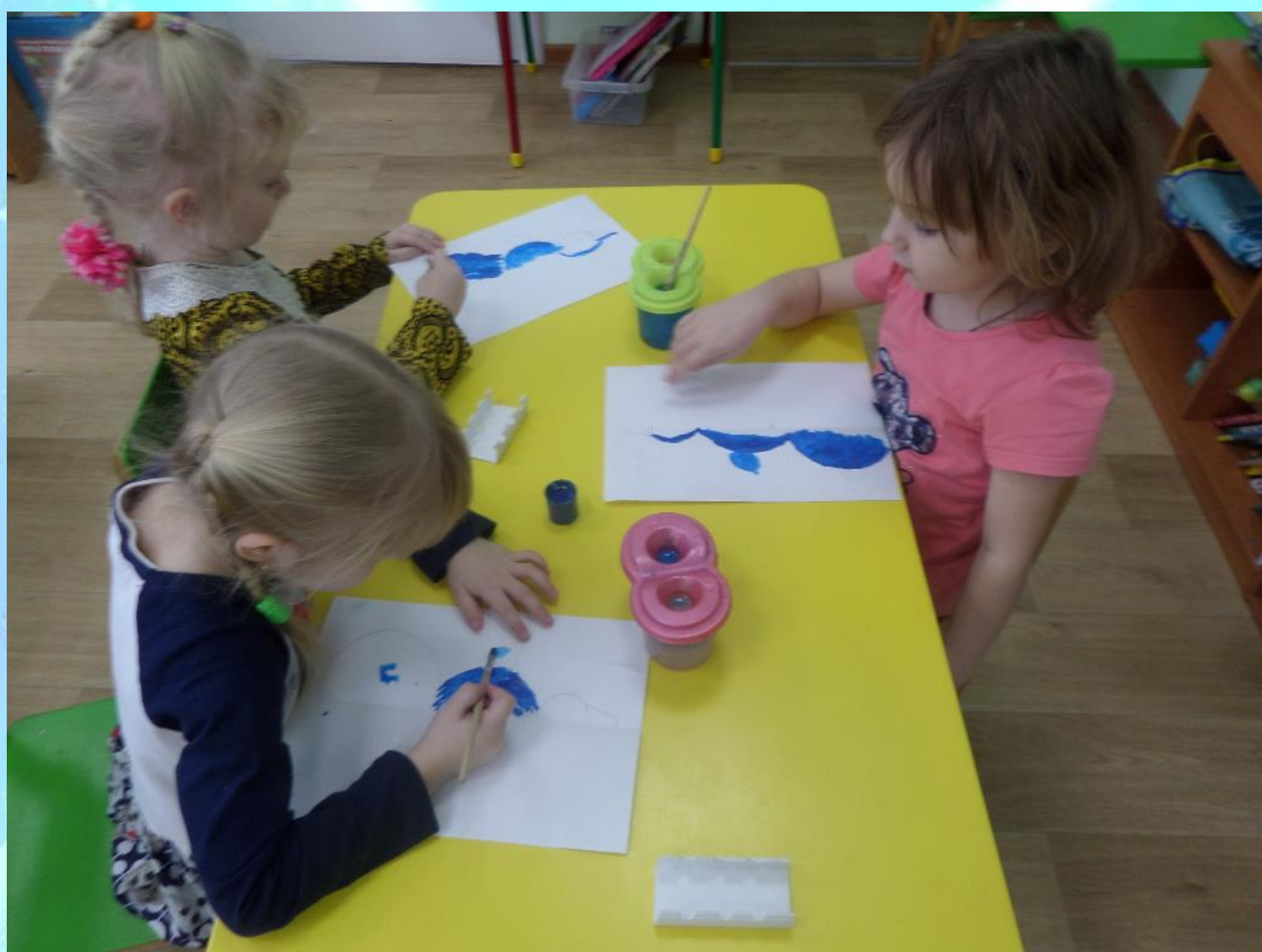
ТРИЗ в изобразительной деятельности «Монотипия»