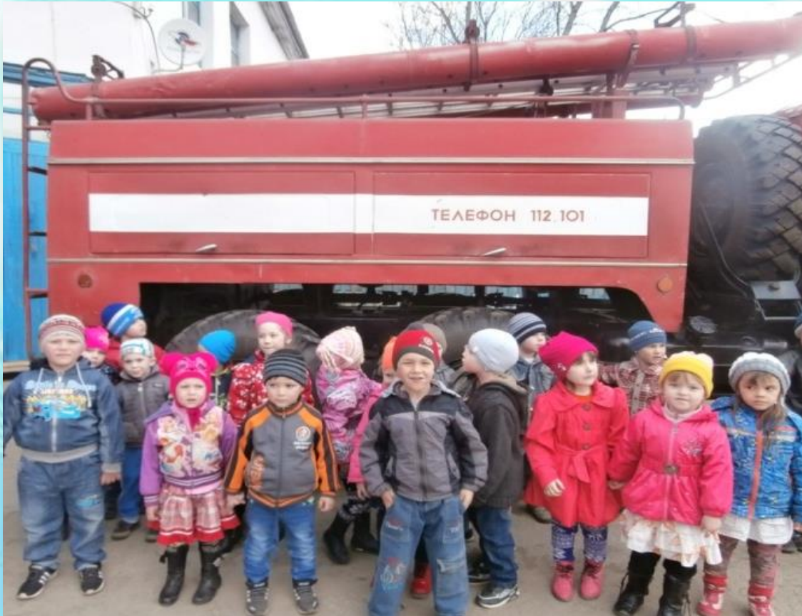
Сотрудничество с ВДПО г.Нижеудинска