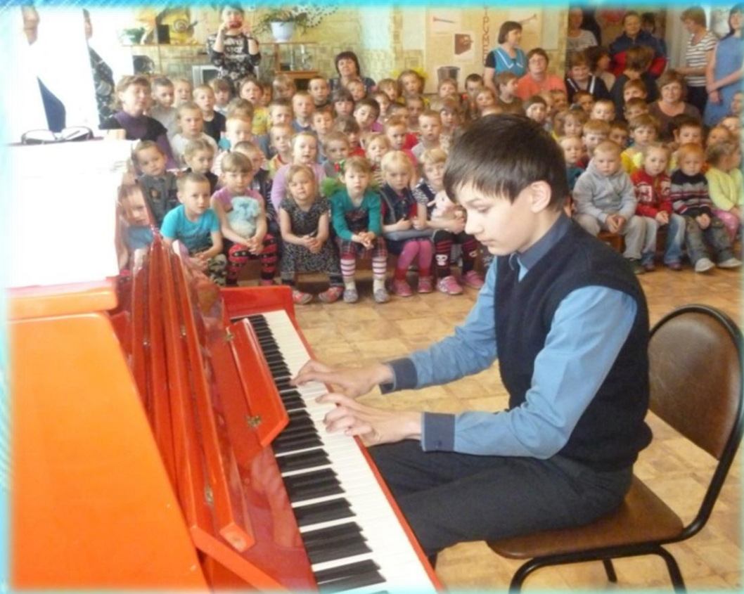
Игра на фортепьяно