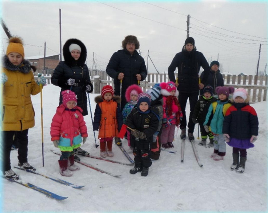
«Школьная лыжня» - целевая экскурсия