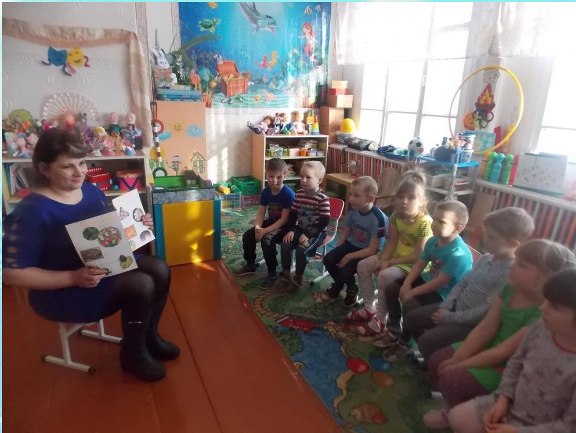
«Встреча с интересными людьми» - повар школьной столовой проводит беседу о пользе витаминов