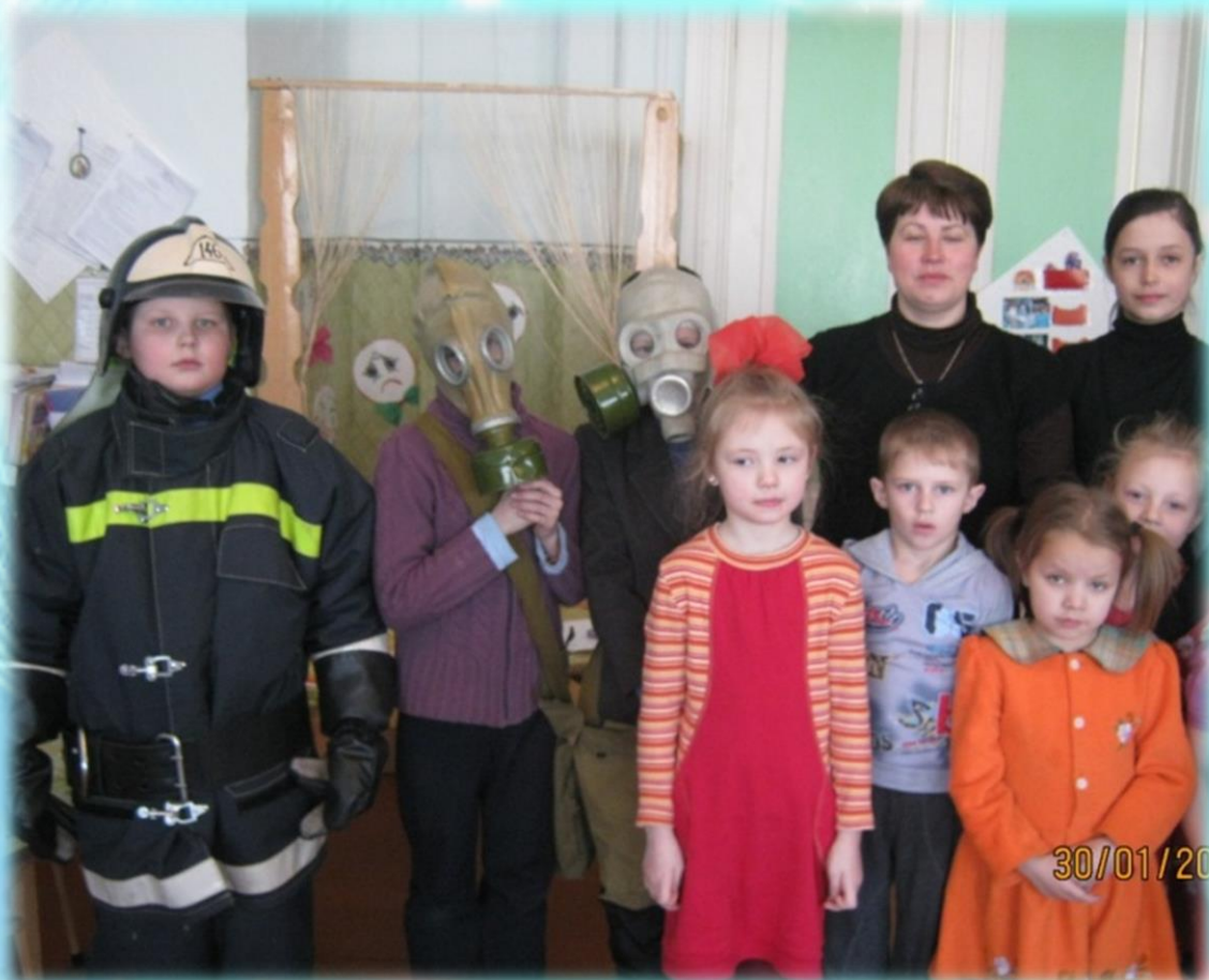
Детям о пожарной дружине