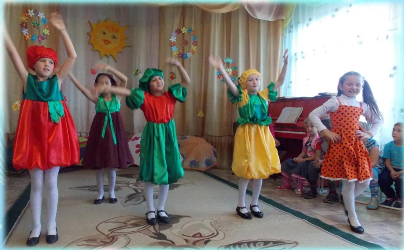
Выступление эстетического класса ДШИ