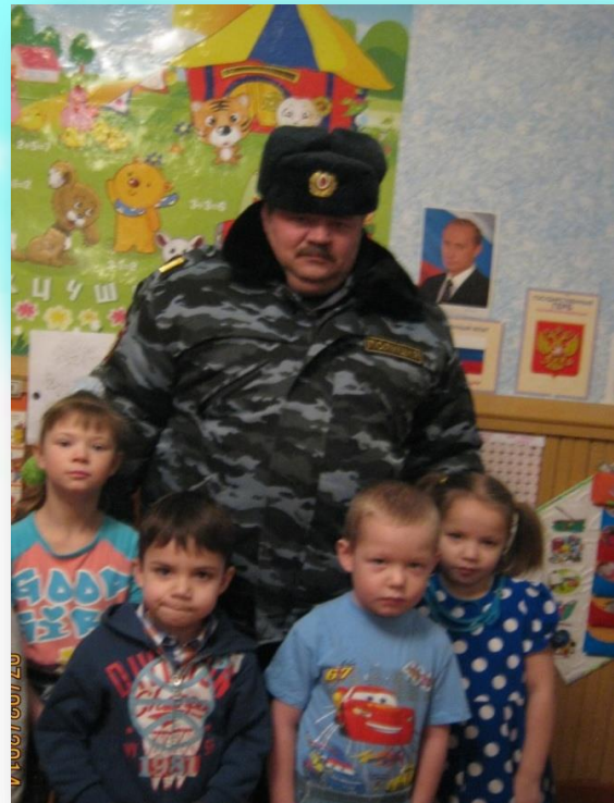
Встреча сотрудника с воспитанниками