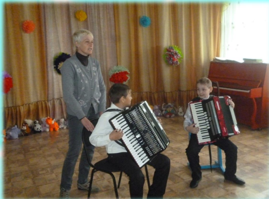
Знакомство с инструментом аккордеон