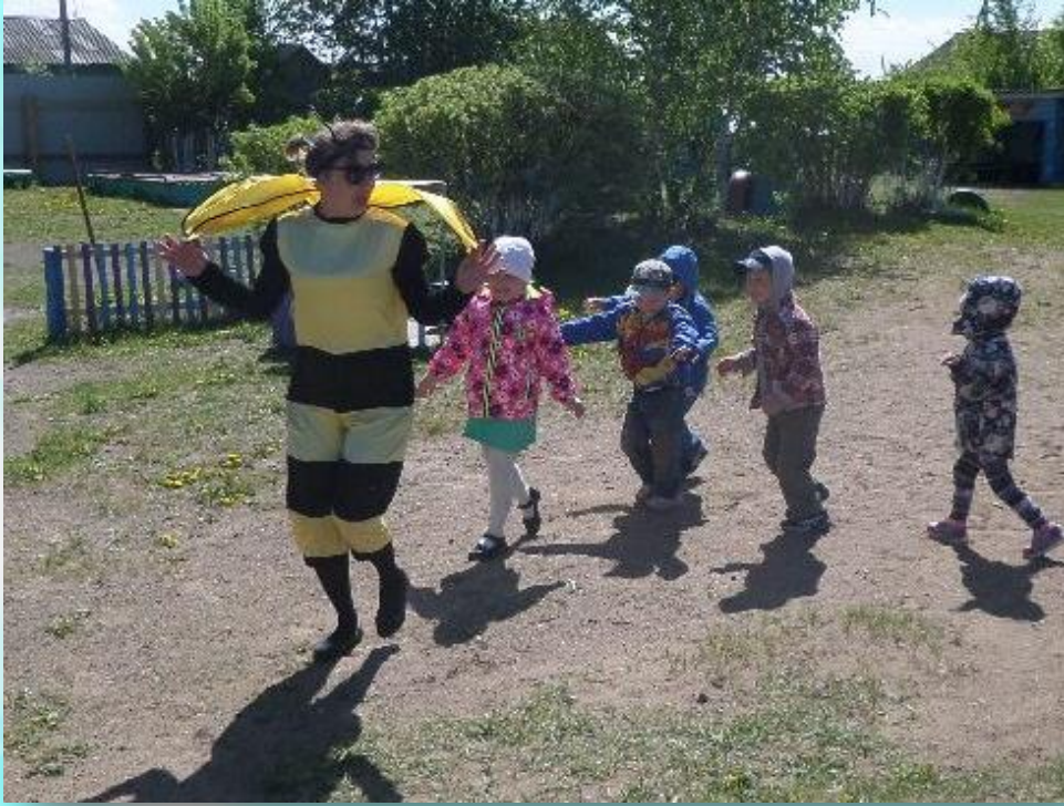
Проведение развлечений для детей