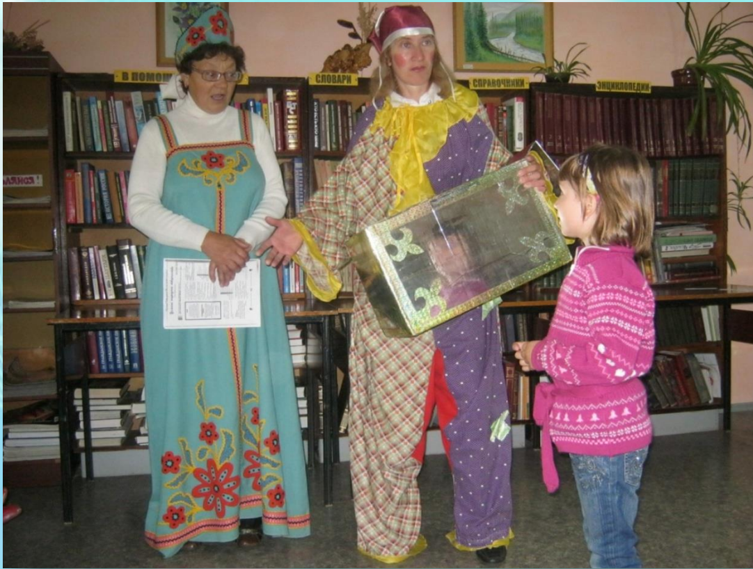
Совместное развлечение «Чудеса из сказки»