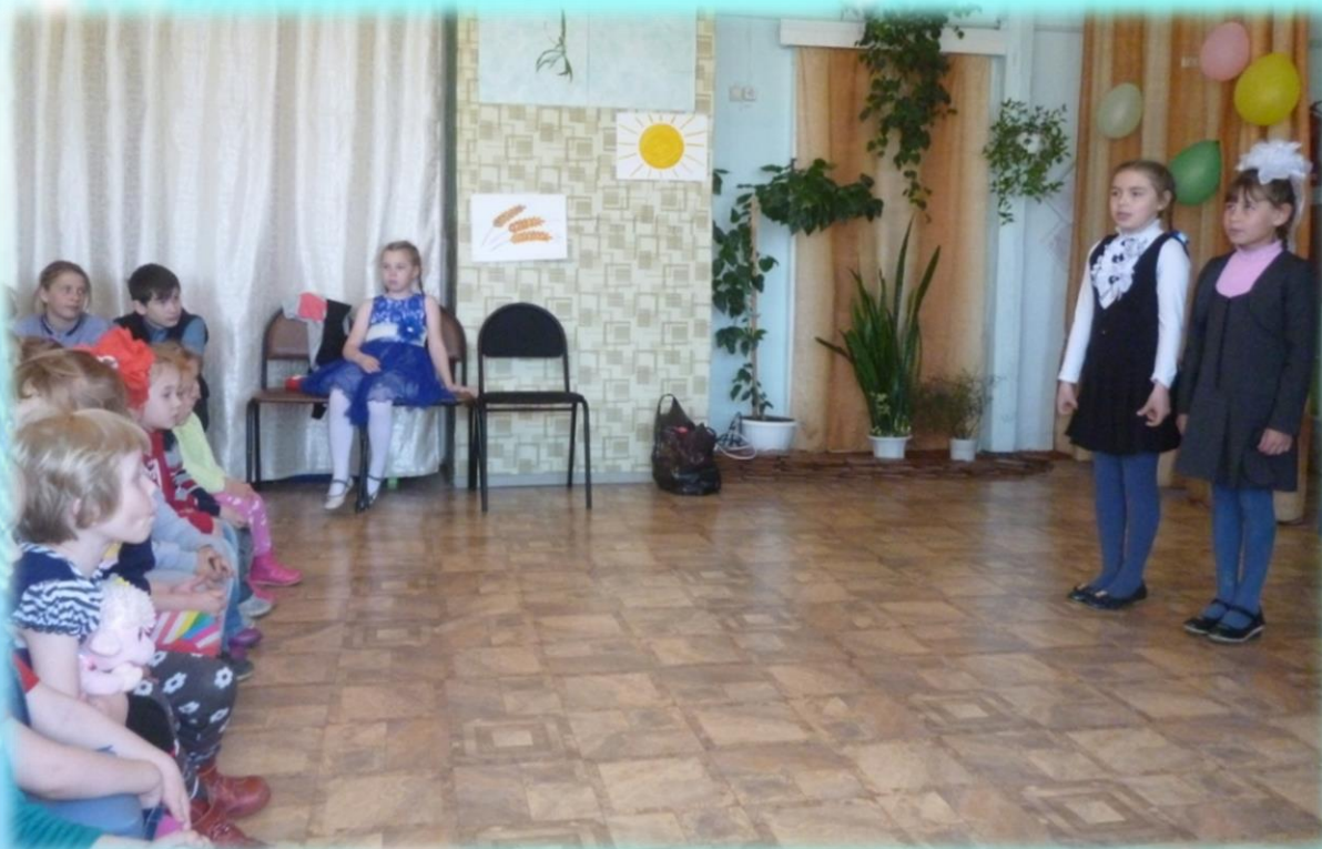
Знакомство с эстетическим классом ДШИ