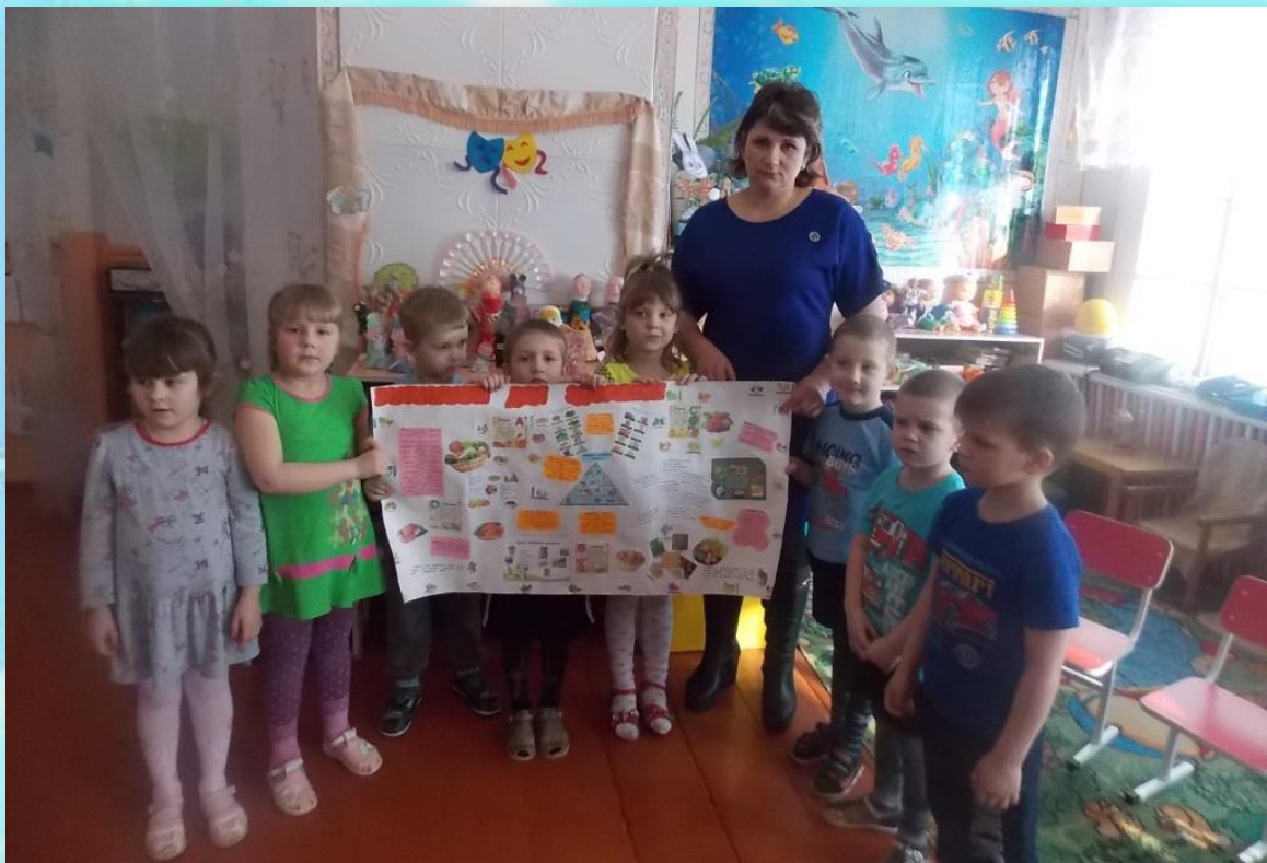
Изготовление газеты о витаминах для здоровья