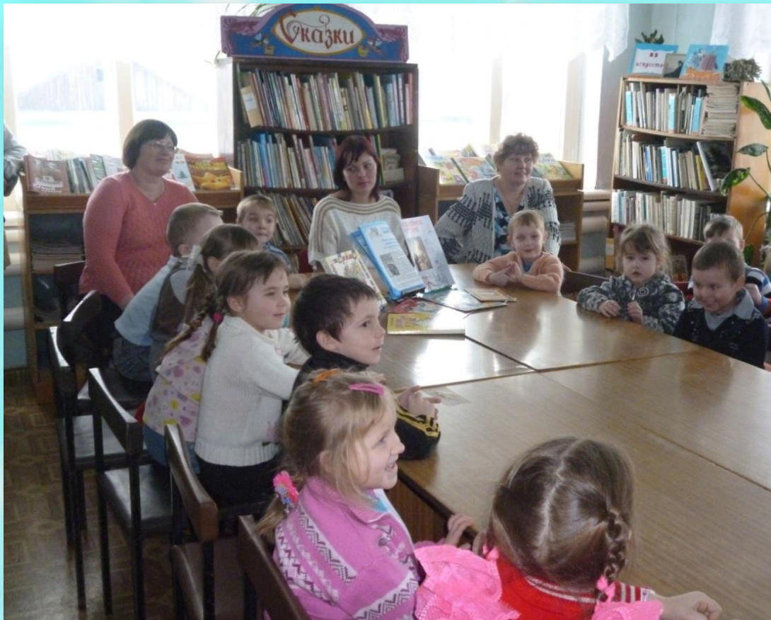
Тематическая встреча «День рождения С.Я.Маршак»