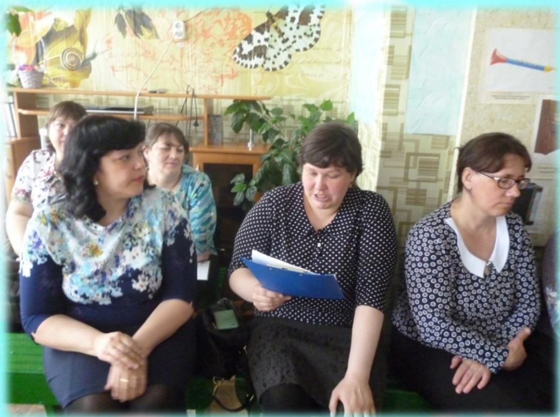
Круглый стол «Преемственность в контексте ФГОС»