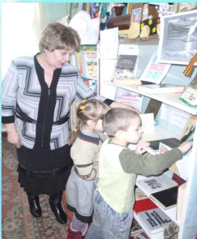
«Знакомство с выставкой книг о войне»