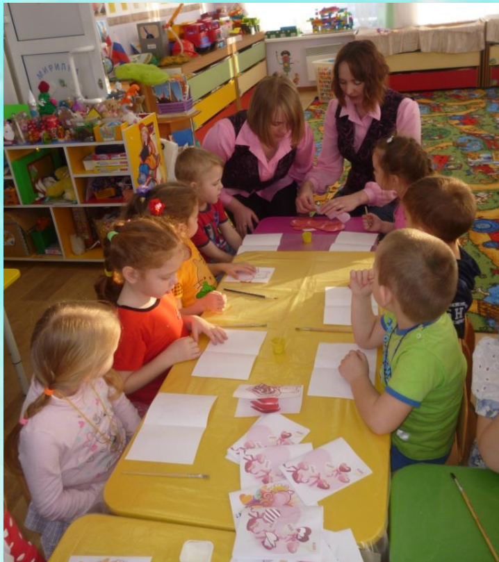
Мастерская «Валентинка к празднику»