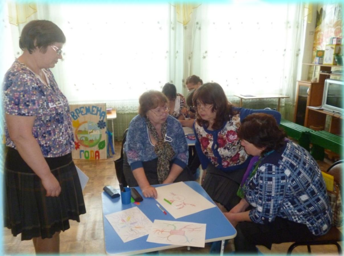
Мастер-класс для учителей «Интеллект-карта»