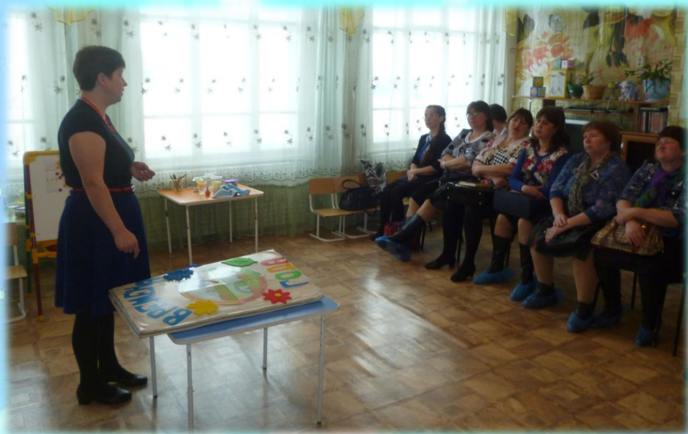
Мастер-класс для учителей «Лэпбук»