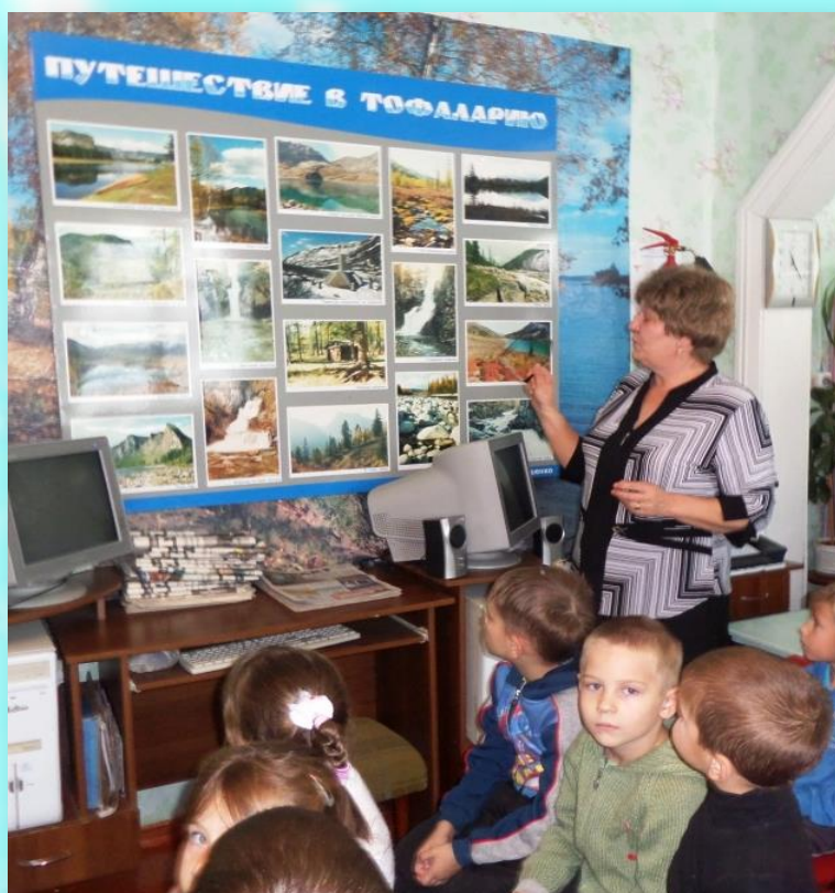
«Экскурсия по Тофаларии»