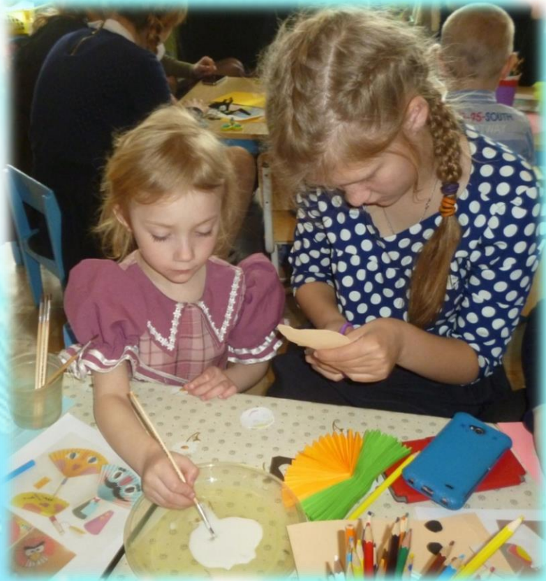
День открытых дверей для школьников. Изобразительная деятельность