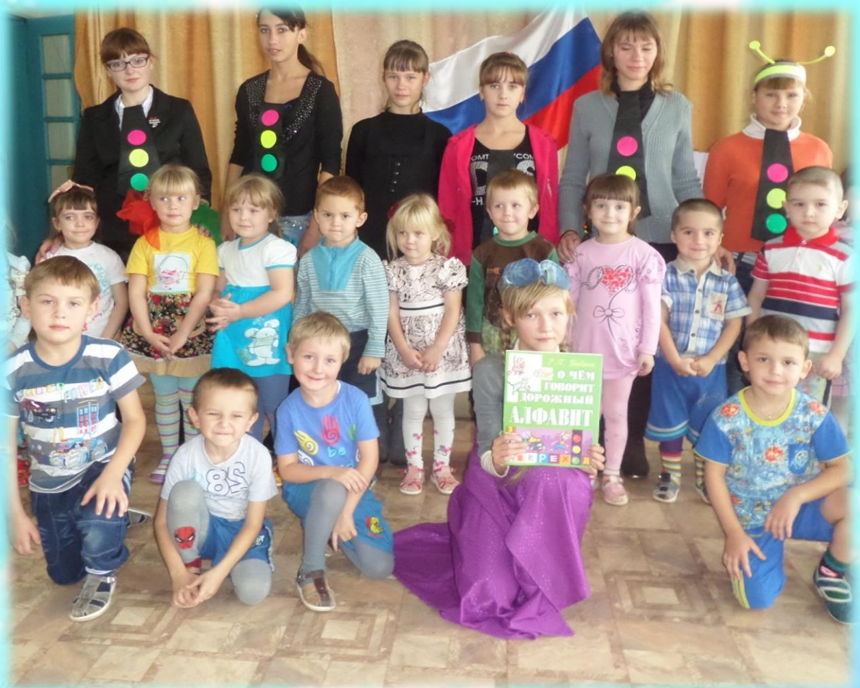
«ДЮП» в гостях у дошкольников