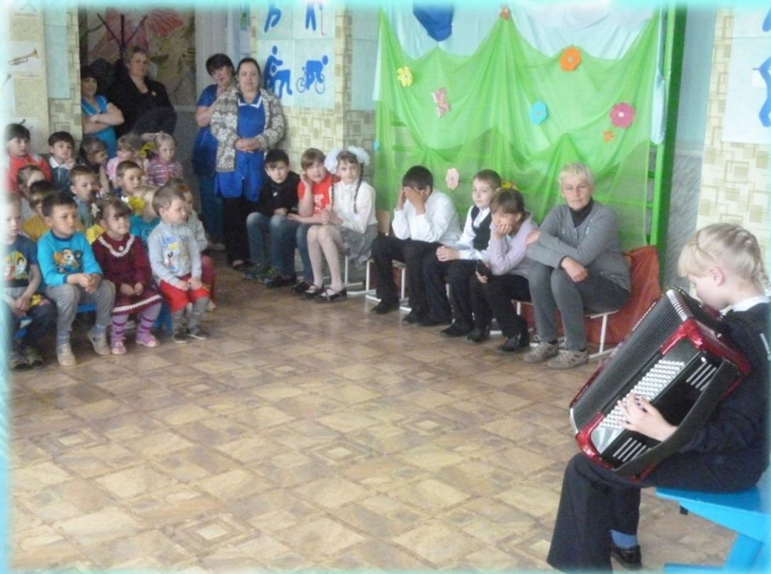
Знакомство с инструментом аккордеон