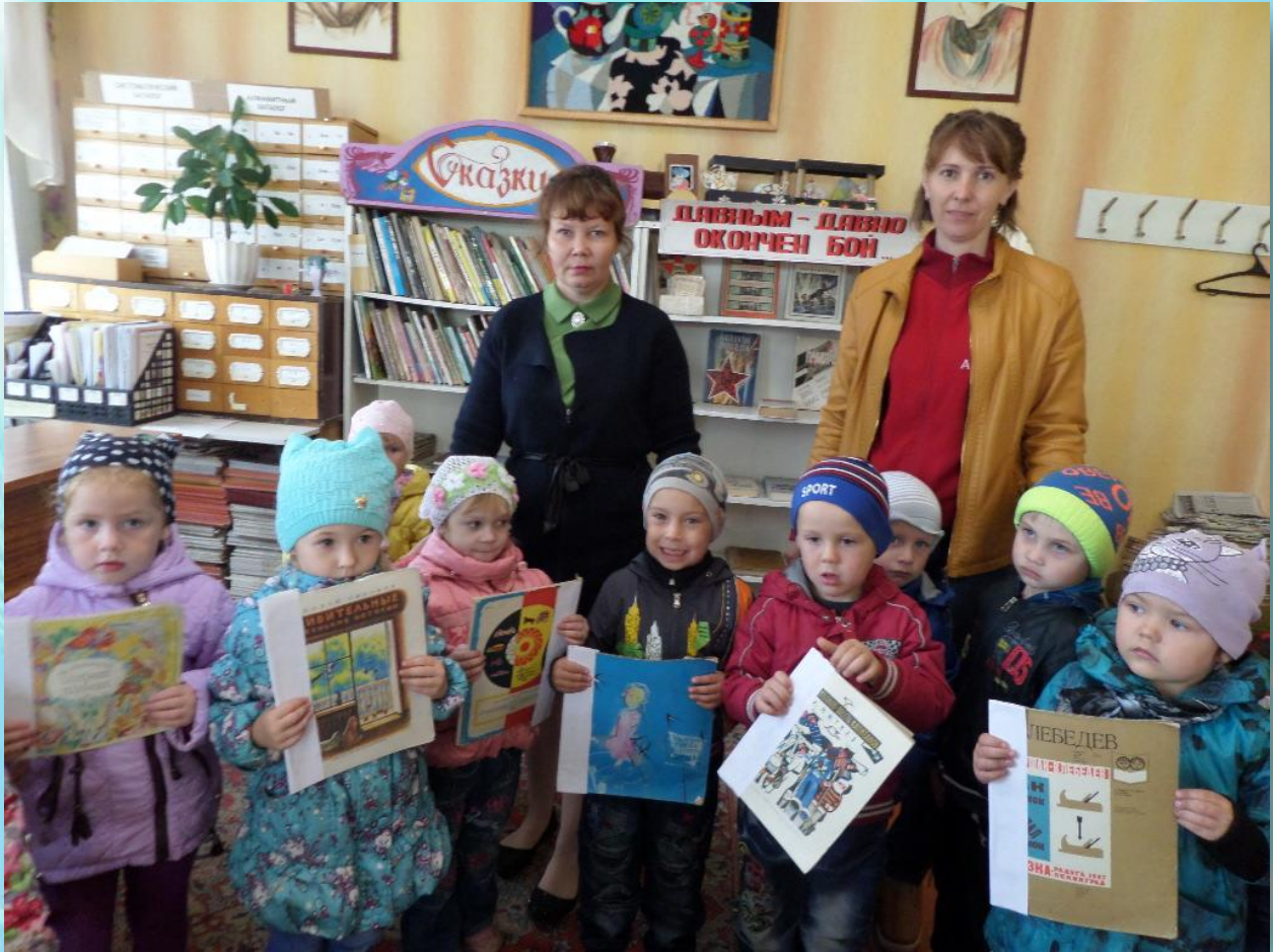
Акция «Книжкина больничка»