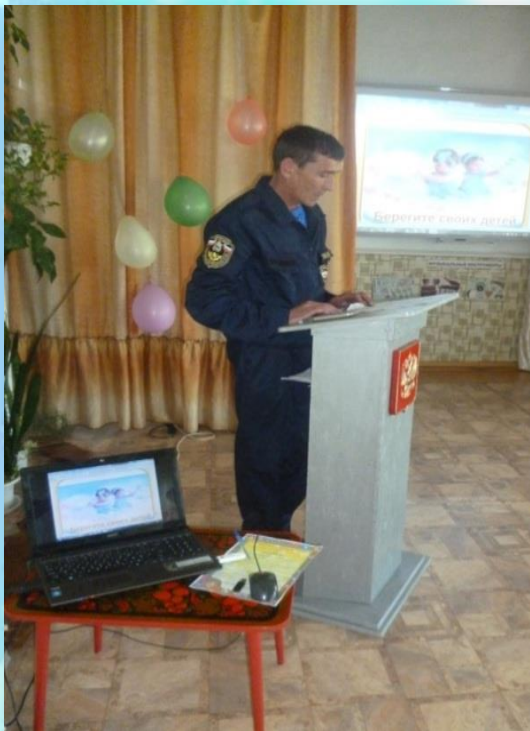
Встреча родителей с сотрудником